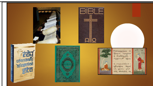
Obrázek vpravo dole: https://www.bl.uk/collection-items/extracts-from-the-tipitaka

Náboženství si obvykle velice váží určitých textů, které považují za posvátné. Pro některá náboženství jsou totiž dokonce napsané nebo inspirované Bohem. (Bůh v nich působí.)