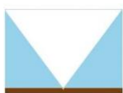
Wie ein Senfkorn