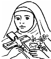
sv. Terezie z Lisieux

Každý světec je originální a má svou vlastní historii. Podle následujících vět doplň informace o těchto čtyřech světcích do tabulky, aby byla úplná.