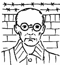
sv. Maxmilián Maria Kolbe