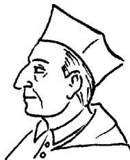
sv. Karel Boromejský