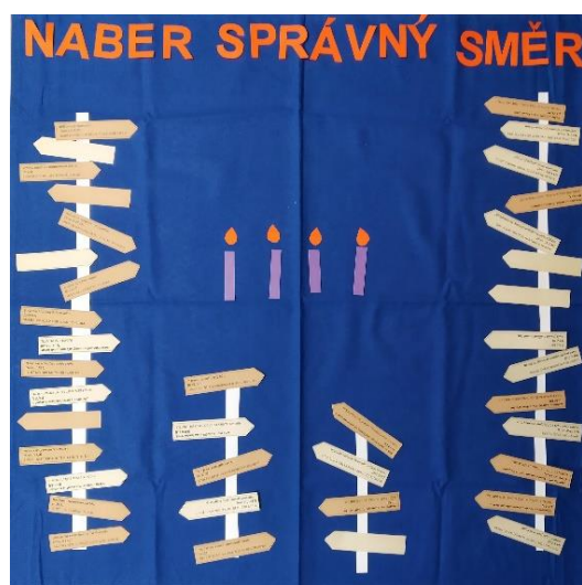
Obr. 1 – Nástěnka v adventu

Pevný podklad dostatečné velikosti obalíme plátnem v tmavé barvě (např. modrá). Pro rodinu stačí podklad formátu A3, pro farnost je potřeba zohlednit počet farníků, kteří se do aktivity zapojí. Na nástěnku připravíme několik dlouhých pruhů papíru, které budou představovat tyče pro směřovky (viz obrázky 1 a 2). Na pruhy papíru budou během adventu účastníci připevňovat vystřižené směřovky s textem (soubory pro vytištění jsou k dispozici na webu). Uprostřed nástěnky budou během adventu umístěny 4 papírové svíčky a každou adventní neděli přibude „plamínek“ z papíru nad jednou svíčkou. O Štědrém dnu se papírové svíce zamění za obrázek betléma (k vytištění na webu).