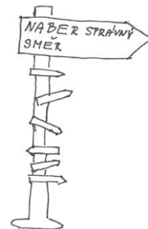
Obr. 3 – Rozcestník

Zručnější řemeslníci mohou zkusit vyrobit „ukazatel směru“ (viz obrázek 3). Na ukazatel se pak během adventu připevňují směrovky. Na Štědrý den se ukazatel postaví k farnímu nebo rodinnému betlému.